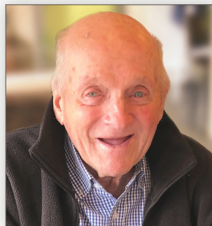
Ancien boucher de Warneton « Au Petit Mountche »

né à Bruges le 12 mai 1933, est décédé à Warneton le 6 avril 2026, entouré de toute sa famille et réconforté du sacrement des malades.